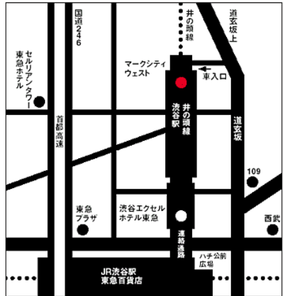
マークシティ・ウエスト 5Fエレベーター・ホールから18Fにあがって右へ